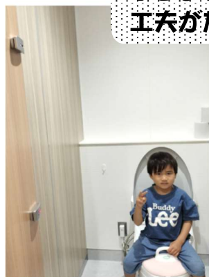
↑ トイレの扉はツーロック 子ども連れでも安心して 利用できます