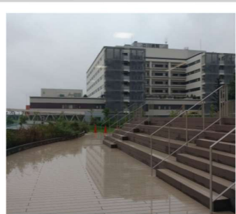
親子用段差のあるベンチ→ 広々ガラス戸を開くと 外は屋上テラス←