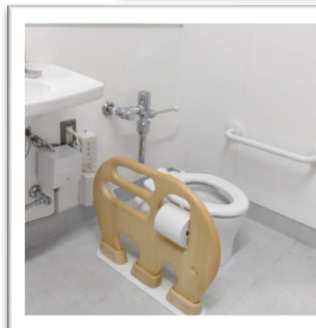
↑ 子ども用トイレ 木製の象さんのペーパーホルダー にほっこり