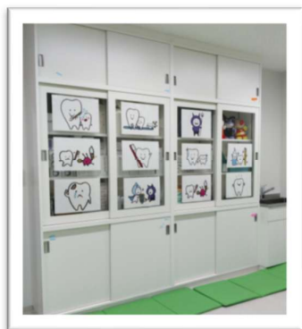
↑ 歯科相談室 一角のケース 子どもが怖がらないように 楽しいイラストがいっぱい