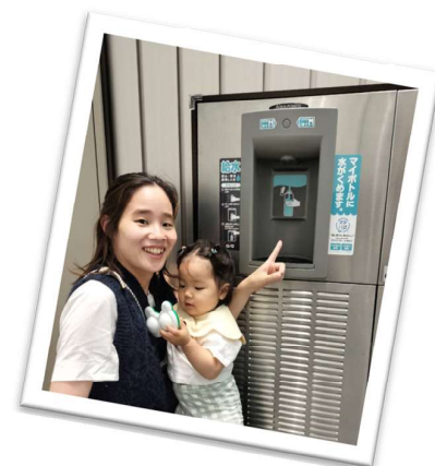
↑ マイボトルに給水できる設備 階段裏にあります