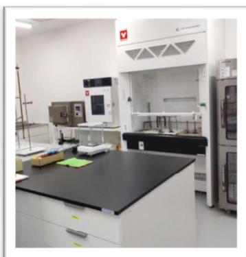
← 栄養実習室 離乳食講座の準備、大人の 減塩講座を行います