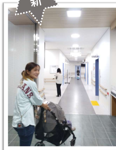
↑ 診療フロアー全景 広々廊下幅は2.5mです