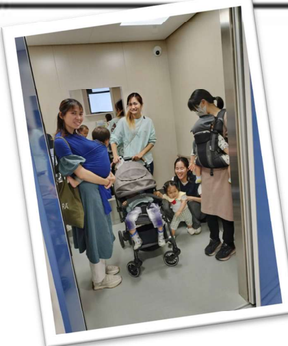
↑ エレベーターは24人乗り ベビーカーが複数でも楽勝